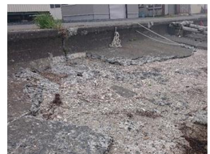
水叩きコンクリートの老朽化状況（稚内港海岸）