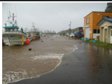
防波堤を越波した波の遡上状況 (鴛泊港)