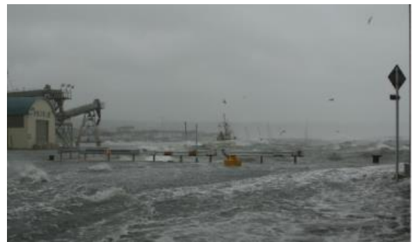
防波堤(南)の越波状況(網走港)