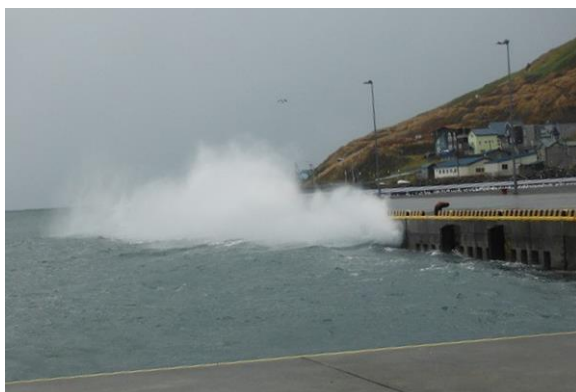
越波等による港内擾乱状況(香深港)