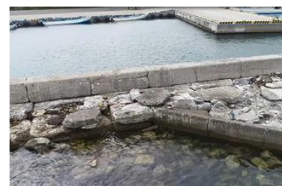
防波堤本体工のコンクリート劣化状況 (えりも港北防波堤)