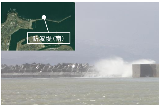
防波堤(南)の越波状況(留萌港)