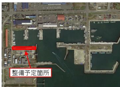
農水産物輸出促進のための遊休化した船揚場・護岸の岸壁改良（苫小牧港 西港区）