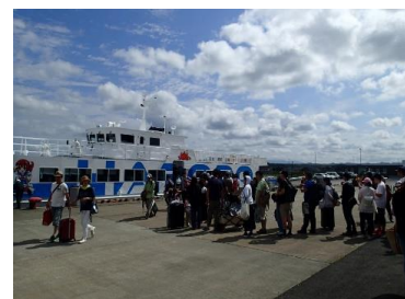
離島航路フェリー利用状況 (羽幌港)