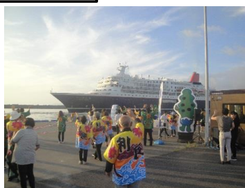
耐震強化岸壁でのクルーズ船 おもてなし(沓形港)