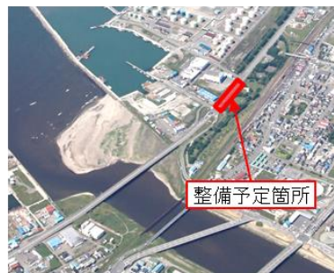
国際物流ターミナル（穀物）に接続する西港道路改修（釧路港 西港区）