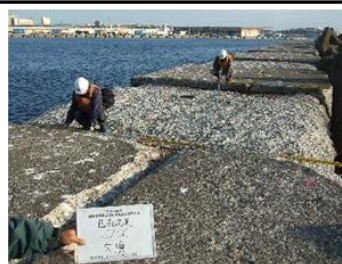
防波堤上部工の欠損状況 (釧路港東港区西防波堤)