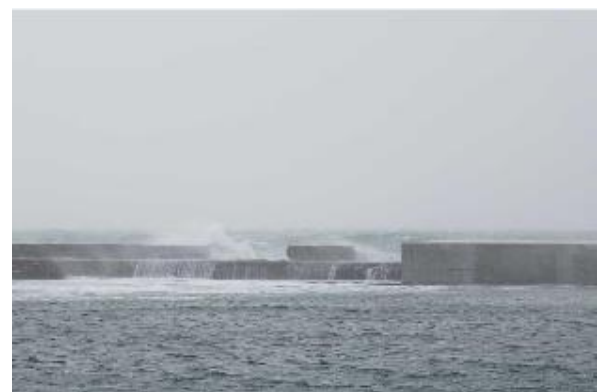
老朽化した防波堤(北外)の補修(室蘭港)